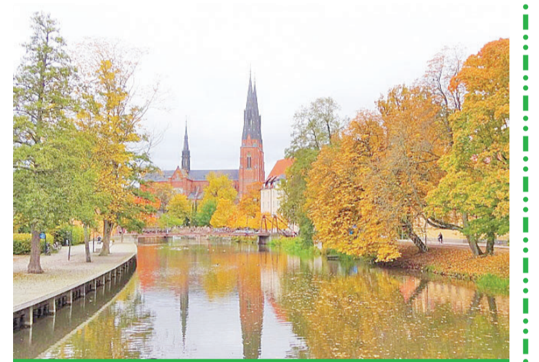
拥有大型教堂的乌普萨拉仍然是瑞典教会的所在地。