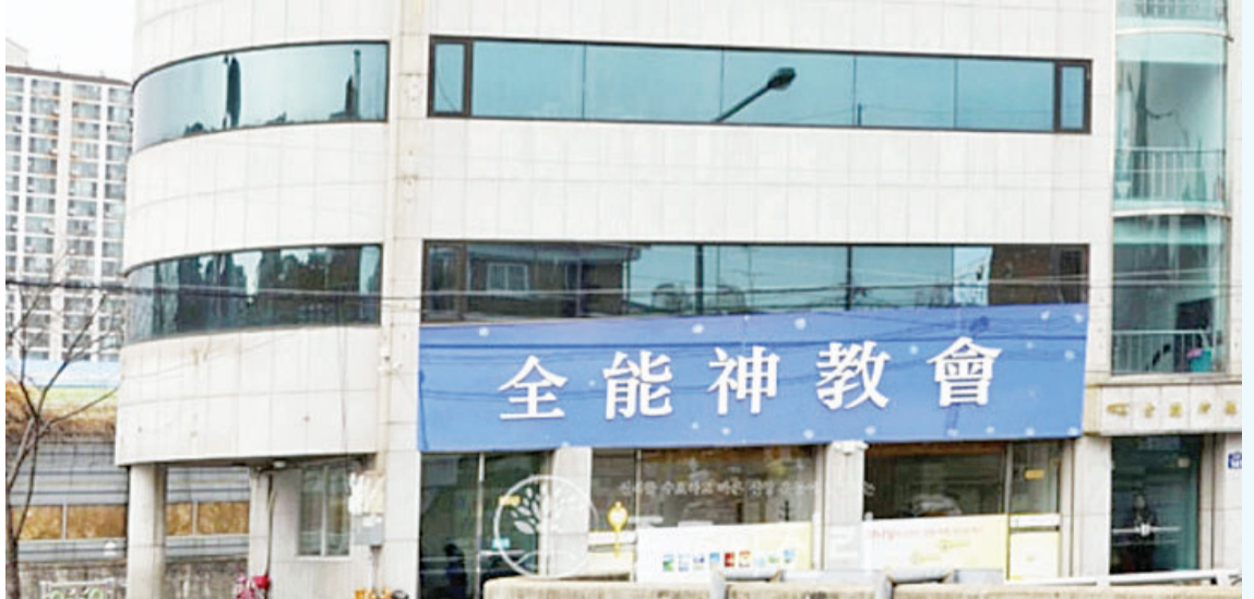
首尔市九老区的全能神教会。

异端全能神教(另称: 东方闪电)发展迅速, 并在韩国成立东光电影公司, 制作及发行电影、音乐视频等, 软性输出异教。