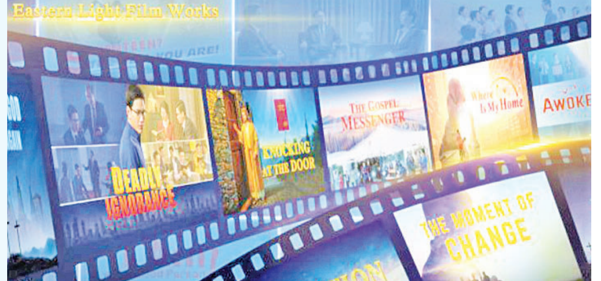
全能神教发行的电影。

去年初教派举办布道会, 内容讲及新冠肺炎病毒蔓延到无法控制地步, 并列感染人数过数十万宗、全球各国包括韩国、日本、台湾、美国等全部沦陷, 然后提出叫人渴望预知未来的出路: “大灾难到底预示什麼?” 聚会以“国际布道会”名义作为噱头, 聚会期间在东南亚国家不同时段设有直播。